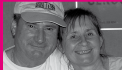
milo aus der küche marica for housekeeping