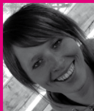
kathi vom square