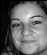
viktoria aus dem café (zweite saison)