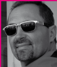
emil beteiligt und verantwort- lich für „alles“ (inkl. frauen) im betrieb!