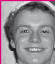
stoffl joker aus der küche